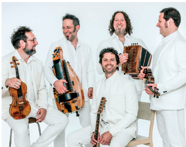
LE VENT DU NORD