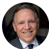
FRANÇOIS LEGAULT Premier ministre du Québec