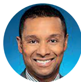
LIONEL CARMANT Député de Taillon, Ministre délégué à la Santé et aux Services sociaux